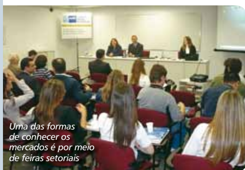
Uma das formas de conhecer os mercados é por meio de feiras setoriais