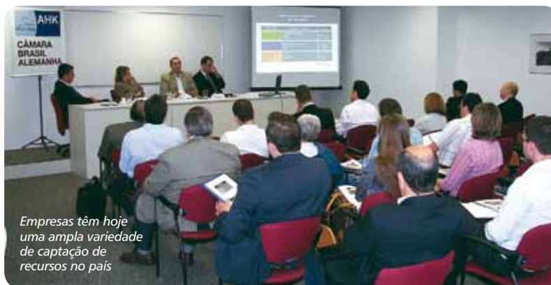
Empresas têm hoje uma ampla variedade de captação de recursos no país

Para montar um processo de abertura de capital, é preciso criar um case de investimento de modo a atrair o interesse de potenciais investidores. Simultaneamente, é necessário avaliar o timing adequado, os aspectos macroeconômicos, as características do setor, e dispor de um histórico dos últimos investimentos da empresa e de seus respectivos desdobramentos. Des-