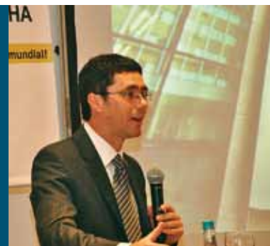
Diretor de gestão e planejamento da Apex-Brasil, em reunião-almoço da Câmara Brasil-Alemanha de Porto Alegre, em 21 de outubro

Apresentando déficits comerciais com uma série de países com os quais o Brasil historicamente mantinha superávits, a balança comercial brasileira (exportações menos importações) deverá apresentar uma forte queda em 2010, previu o economista. De acordo com cálculos da Apex-Brasil, o país deve fechar o ano com um saldo de US$ 18 bilhões diante de US$ 24,6 bilhões do ano anterior – uma estimativa otimista em comparação ao mercado financeiro que prevê para 2010,