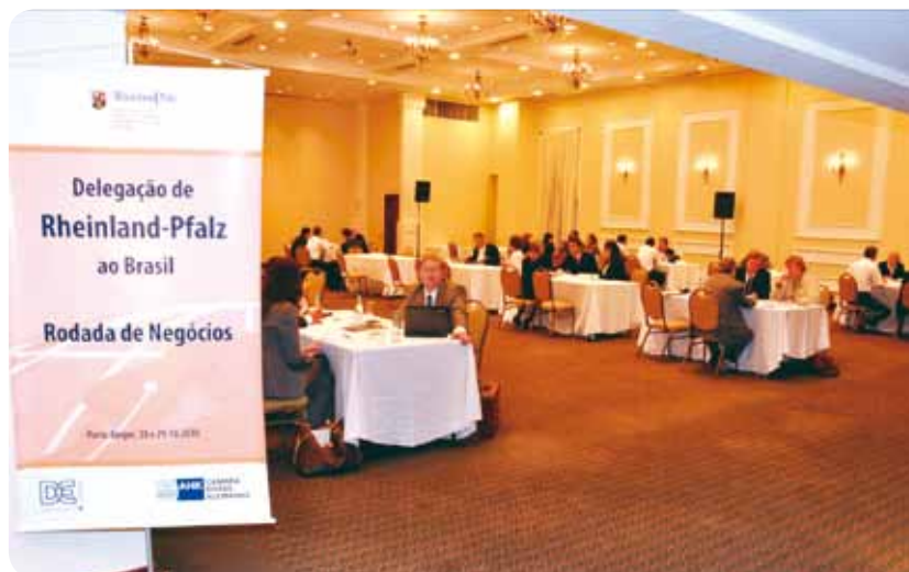
Alemães estão cada vez mais interessados no mercado brasileiro

Câmara organizou encontro com empresários no Sheraton Hotel